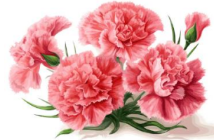
カーネーション 花言葉:「無垢で深い愛」