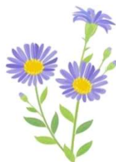
紫苑(シオン) 花言葉「追憶」「君を忘れない」