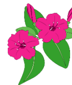
オシロイバナ (オシロイバナ) 花言葉「臆病」「内気」「恋を疑う」