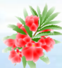
鳳仙花(ホウセンカ): 花言葉:「短気」「燃えるような愛」

また、水分補給は必要不可欠ではありますが、覚えておかなければならないことがあります。それは「一度にたくさんの水を飲まない・塩分も一緒に摂る」こと。汗を大量にかいた後は、身体内部の成分バランスも崩しがちのため、かえって熱中症の症状を悪化させる危険もあるのです。ちなみに目安としては、水1リットルに対し2g程度の塩分です。経口補水液などの用意があると良いでしょう。